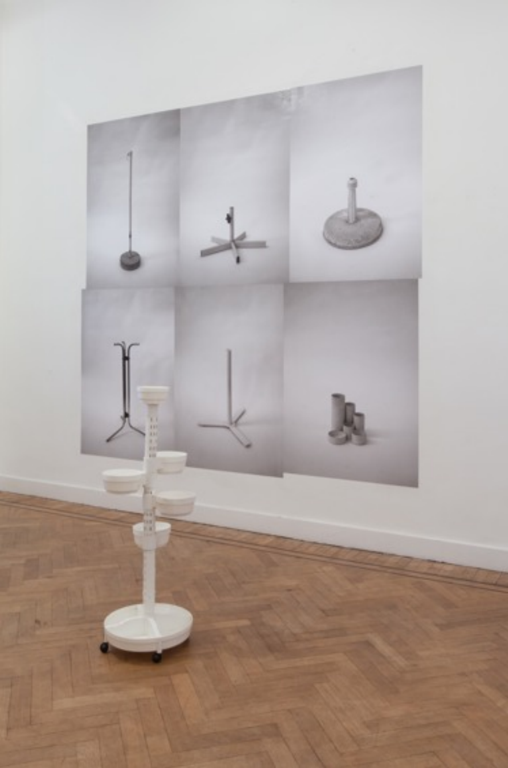
Some Moments Never Sleep

2013 Plastic plantenhouder, zes zwart-wit posters Courtesy Annie Gentils Gallery, Antwerpen 8.000 Euro