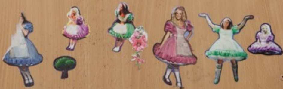
Laten we gaan dansen (detail)