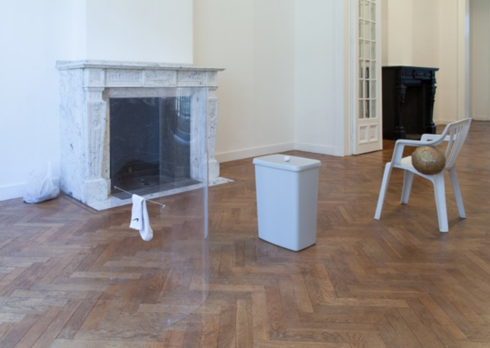
Some Moments Never Sleep (overzicht gelijkvloers)