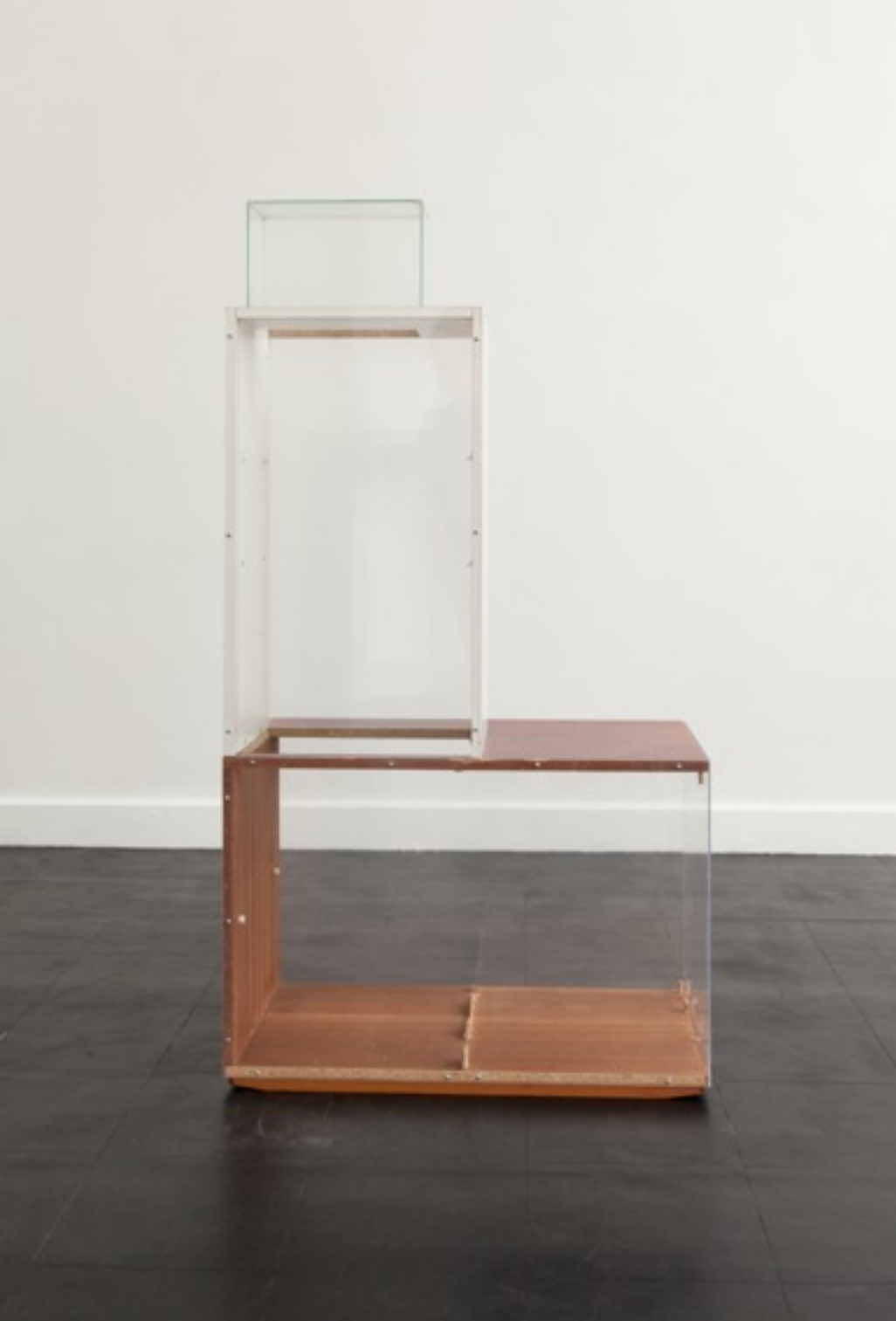
The economy, stupid!

2014 Meubelhout, plexi, glas Courtesy Annie Gentils Gallery, Antwerpen 7.000 Euro