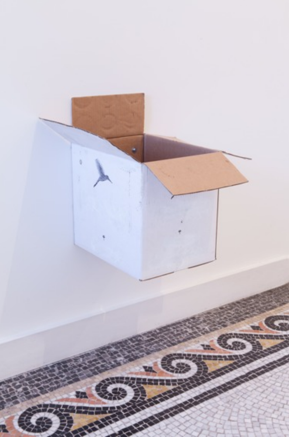
Haar kin vult mijn handen

2013 Kartonnen doos, acrylverf, metalen schroeven 6.000 Euro